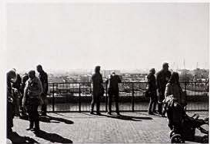
Auf dem Dach des Speichers: Hafensblick

«This place is amaazing» sagt Branford Marsalis, als er die Bühne betritt. Damit meint er den grossen Saal der Philharmonie, in dem man sitzt wie in einem Korallenriff. Von hier aus rückblickend be-