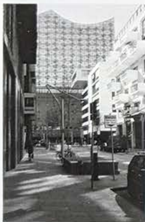
Blickfang aus der Strasse am Kaiserkai

Am I asking for the moon? Is it really so implausible? That you and I could soon, Come to some kind of arrangement? I'm not asking for the moon, I've always been a realist, When it's really nothing more, Than a simple rearrangement. With one roof above our heads, A warm house to return to, We could start with separate beds, I could sleep alone or learn to. I'm not suggesting that we'd find some earthly paradise forever, I mean how often does that happen now? The answer's probably never. But we could come to an arrangement, a practical arrangement, And you could learn to love me given time. —