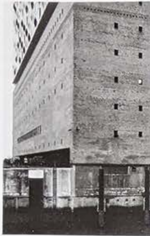
Einfahrt und Zugang als breiter Schlitz

Ich stelle mich an das Geländer über der Tunnelöffnung: Von hier aus ist endlich eine irgendwie anmutige Bewegung festzustellen, eine Transformation der