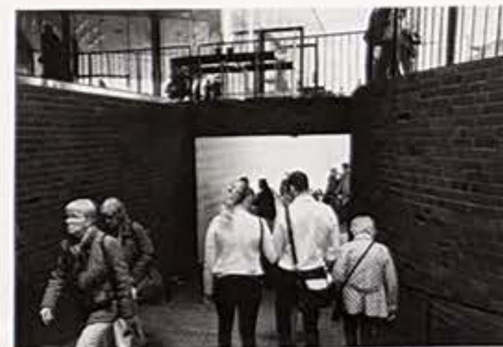
Eingang zu den Rolltreppen von der Plaza

Doch es passiert: nichts. Vielleicht ist der Ort noch zu neu, das Interesse des Publikums zu zielgerichtet, zu objektiviert. Ich wende mich dem Aufsichtspersonal zu, das in seinen gelben Leuchtwesten herumsteht: «Gibt es hier irgendwo einen Müll-eimer?» «Leider Nein. Sie können das mir geben.» Es gibt hier auch keine Poller, keine Parkplatzmarkierungen, keine Pflanzkübel oder was sonst auf öffentlichen