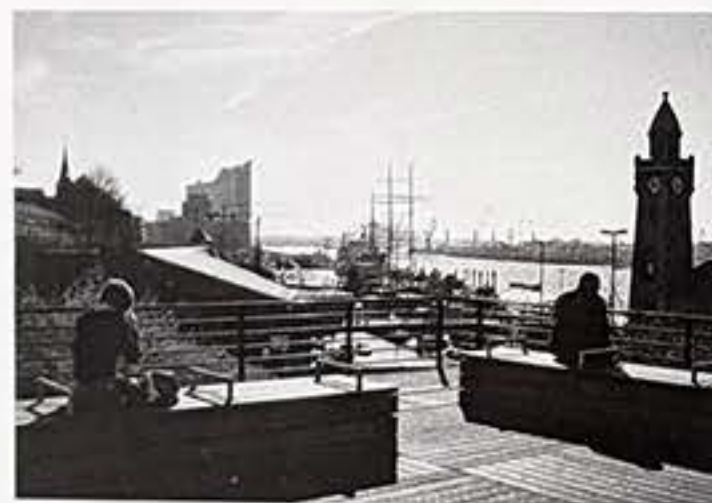
Blick auf die Elbe bei den Landungsbrücken.

An den Check-in eines Flughafens erinnert auch die Eingangssituation. In den ehemaligen Kakao- und Kaffeespeicher wurde in Bodennähe ein langer, horizontaler Schlitz geschnitten. An ihm reihen sich auf (von links nach rechts): Die Zufahrt zu den Park-