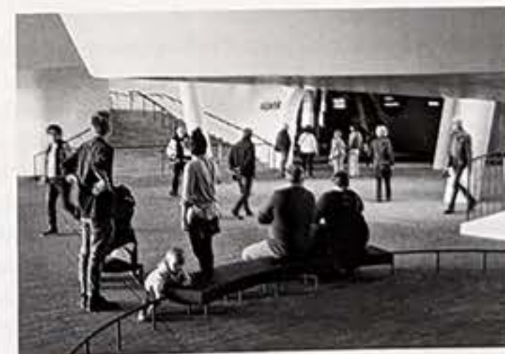
Sitzbank auf der Plaza

Als ich das Störtebeker mit Brötchen und Kaffee in der Hand verlasse, kann ich mich nicht setzen. Schliesslich finde ich die einzige Bank im Innenbe-