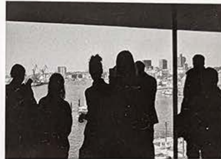
Tief im Speicher: Ausblick nach Westen

werde belohnt. Für meine Hartnäckigkeit. Mein Wiederkehren. Der Ausblick ist jetzt wirklich spektakulär und mit jeder Etage der Foyer-Kaskade, die ich emporsteige, wird er spektakulärer. Die Besucher auf